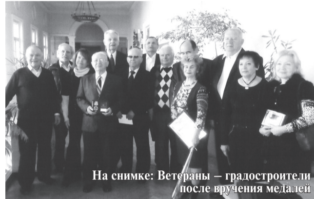
На снимке: Ветераны – градостроители после вручения медалей