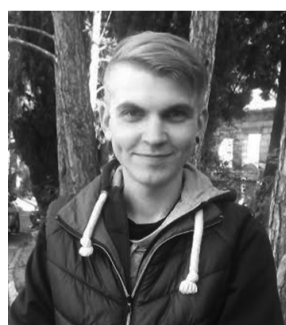
Игорь (фамилию не назвал):

Конечно, хотелось бы, чтобы в центре Ялты было чисто и ни местные жители, ни туристы не спотыкались через всякие лотки и непонятные торговые палатки. Думаю, чтобы настал порядок, нужно время. Если город будут благоустраивать, если будут ремонтировать те же подземные переходы, желающих торговать, хотя бы в самом центре города, станет намного меньше.