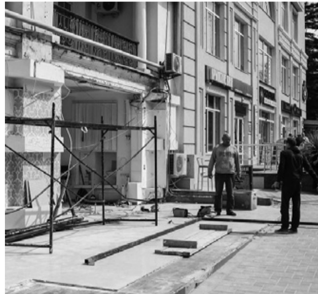
Пристройку у известного ялтинского отеля уже снесли.

Кроме того, по словам главы администрации, на улице Рузвельта установят новое освещение и проведут кронирование дубов.