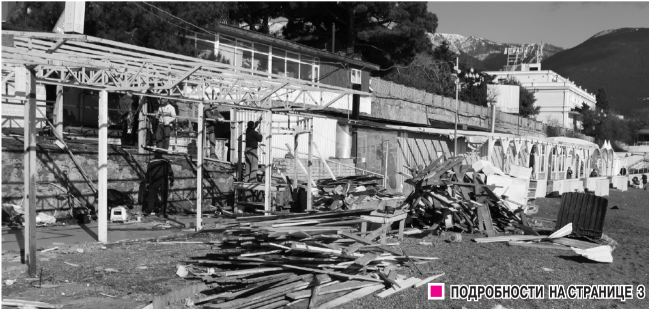
■ ПОДРОБНОСТИ НА СТРАНИЦЕ 3