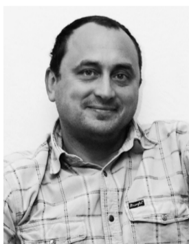
Учредитель и издатель — Игорь Дмитриев