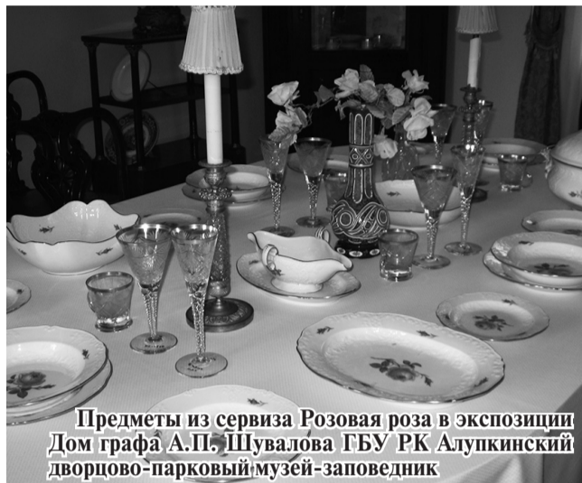
Предметы из сервиза Розовая роза в экспозиции Дом графа А.П. Шувалова ГБУ РК Алупкинский дворцово-парковый музей-заповедник

(СЕРВИЗ «РОЗОВАЯ РОЗА» НА ВЫСТАВКЕ «ДОМ ГРАФА А.П. ШУВАЛОВА»)