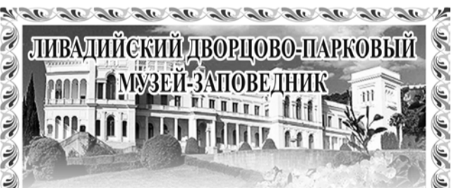
приглашает посетить основные экспозиции:

Тел: (0654) 23-28-25, massandra.palace@gmail.com Каждый первый вторник месяца школьникам вход свободный (при наличии свидетельства о рождении или его копии)