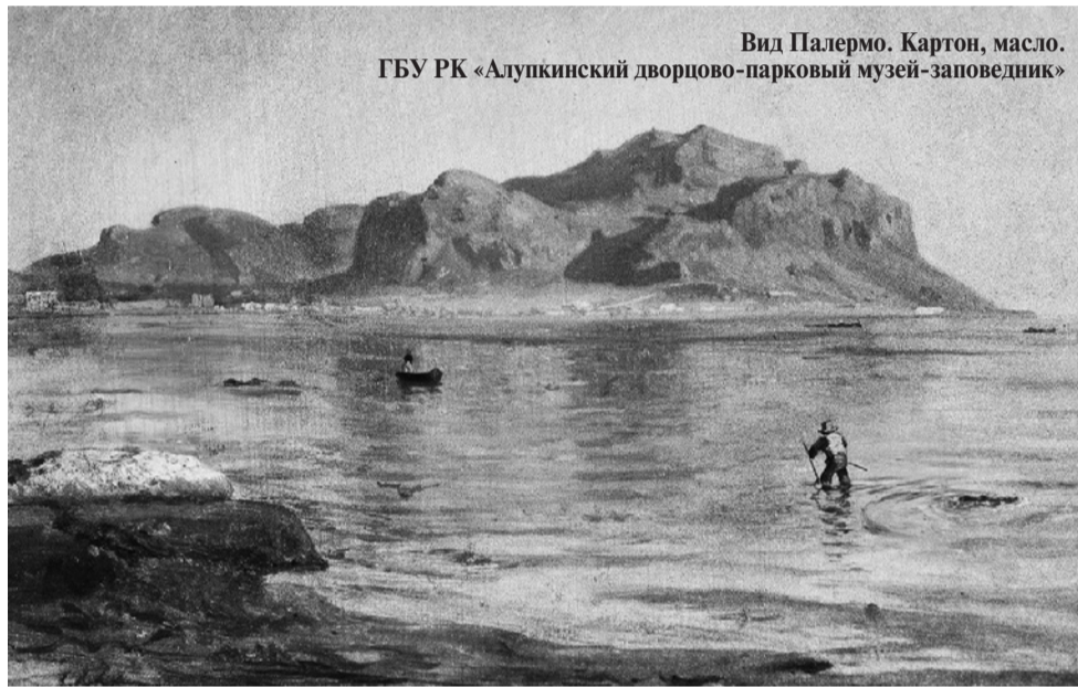
Вид Палермо. Картон, масло. ГБУ РК «Алупкинський дворцово-парковый музей-заповедник»