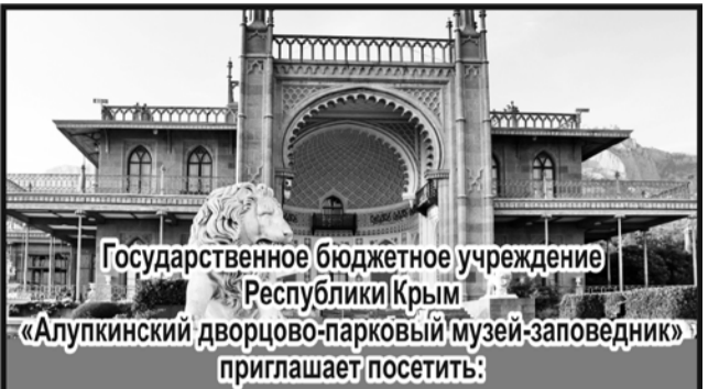
Государственное бюджетное учреждение Республики Крым «Алупкинский дворцово-парковый музей-заповедник» приглашает посетить: