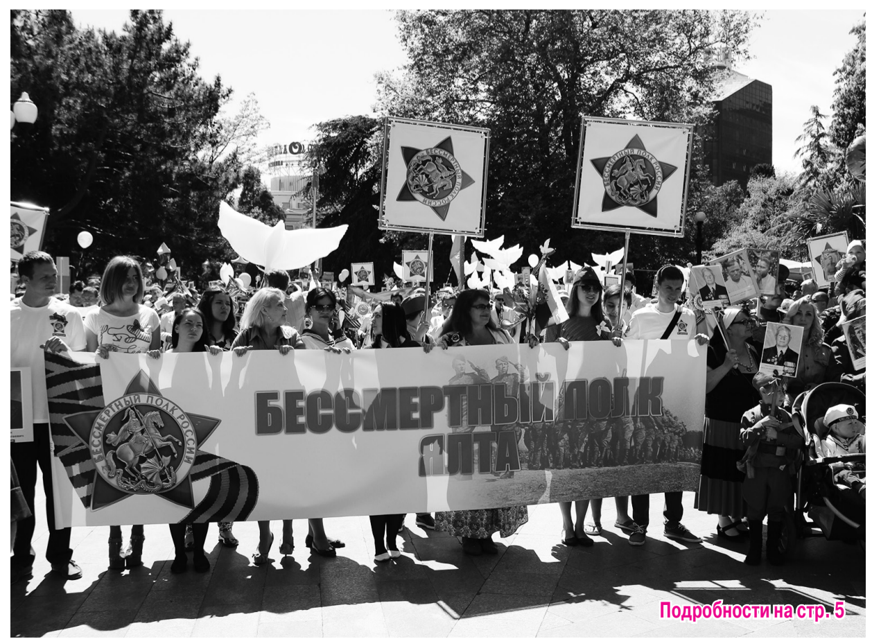
Подробности на стр. 5